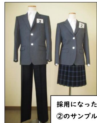
採用になった ②のサンプル