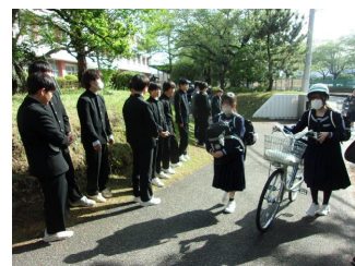
(サッカー部によるあいさつ運動)