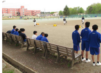
(部活動見学の様子)