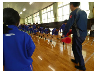
(1年生学年レクで仲を深めました)