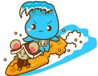
本校キャラクター ナンチュウ と みなみなみ

こちらは本年度のグランドデザインになります。こちらをベースに本年度東海南中学校の教育を推進して参ります。